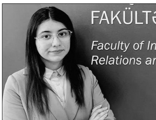
FAKULTET Faculty of International Relations and Diplomacy

27 sentyabr 2020-ci il tarixdə Müzəffər ordumuz Ali Baş Komandan cənab İlham Əliyevin "hücum" əmrinə 30 il düşmən tapdağına çevrilmiş Qarabağ zəncirini amansızcasına qırmaqla cavab verdi. Vətən uğrunda qurban gədənlerin bir qətrəsinin yerdə qalmayacağı qisas günü yetişmişdi. Azərbaycan ordusu hələ 2016-cı ilin Aprel döyüşlərində nəyə qadir olduğunu göstərmişdi. Lakin düşmənin qan tutmuş gözleri bunu görmək istəmirdi. 30 ildən sonra düşmən artıq "böyük Ermənistan" xülyaları ilə yaşadığı vaxt Müzəffər ordumuz qartal qanadlarını gerib onun başının üstünü aldı.