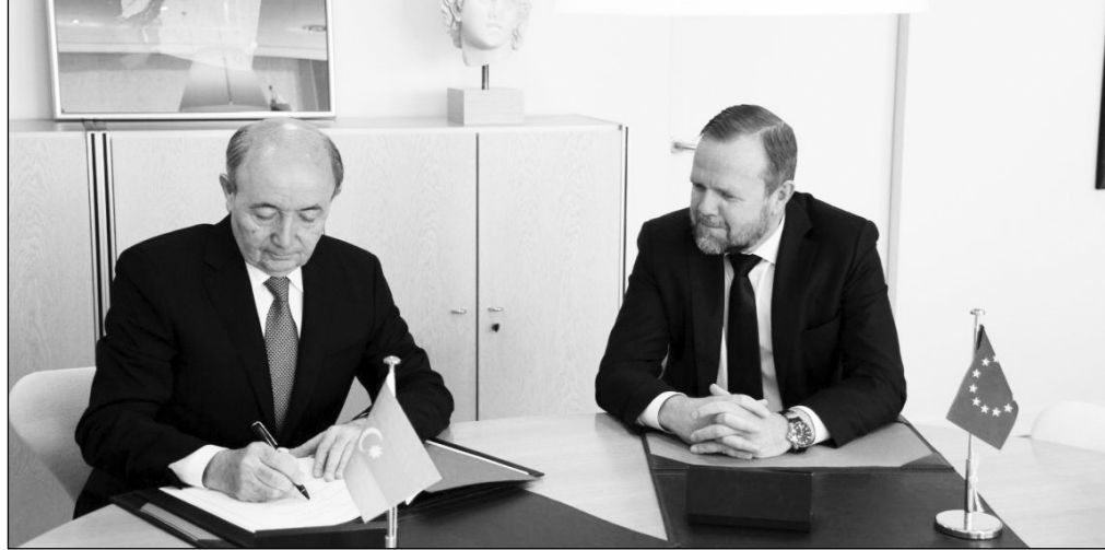
Ölkə Prezidenti İlham Əliyevin rəhbərliyi ilə sabitliyin və təhlükəsizliyin möhkəmləndirilməsi, cinayətkarlıqla mübarizənin gücləndirilməsi, xüsusi-lə cəzanın ləğvü prinsiplərinin təmin edilməsi üzrə önəmli tədbirlər görülür, effektiv beynəlxalq əməkdaşlıq həyata keçirilir.

Cinayətkarlıqla qlobal mübarizədə fəal iştirak edən ölkəmiz bu sahədə beynəlxalq əməkdaşlığın səmərəsini artırılması, müvafiq konvensiyaların təkmilləşdirilərək müasir çağırışlara uyğunlaşdırılması ilə bağlı öz töhfəsini verir. Ədliyyə Nazirliyi tərəfindən təkliflər irəli sürülür, o cümlədən yeni müqavilələrin hazırlanmasında yaxından iştirak edilir.